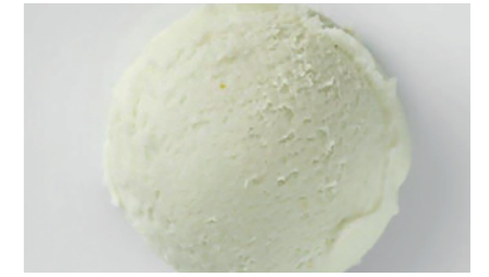
603152 Sorbetto Mela Verde Grünes Apfelsorbet