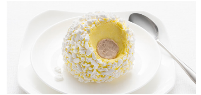
606030 Tartufo Bianco Weißer Zabaione-Trüffel Kaffee | Zabaione | Baiser

🕒 85 g/ Stk. 📦 12 Stk./ Krt. 🍴 servierfertig