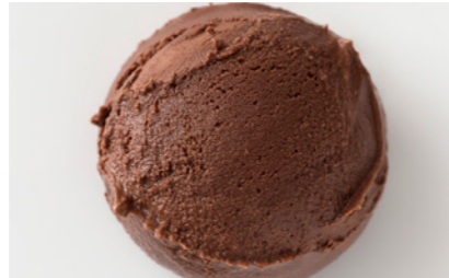
606474 Cioccolato Schokoladeneis