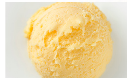
606788 Sorbetto Mandarino Mandarinsorbet