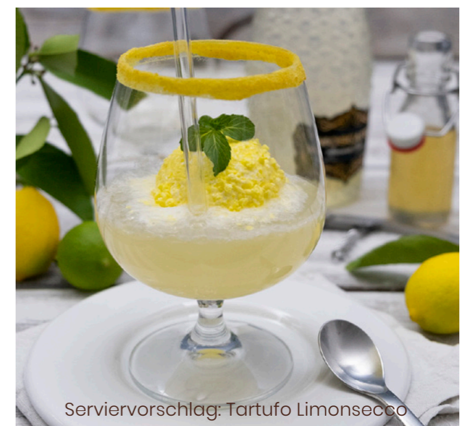
Serviertipp: Tartufo Limoncello

🕒 75 g/ Stk. 📦 12 Stk./ Krt. 🍴 servierfertig