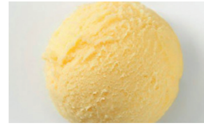
606160 Sorbetto Mango Mangosorbet