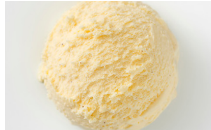
606467 Vaniglia Vanille-Milchspeiseeis