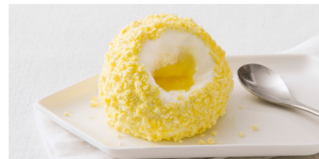
606207 Tartufo Limoncello Zitronen-Limoncello-Trüffel Zitrone | Limonenlikör | Baiser

🕒 75 g/ Stk. 📦 12 Stk./ Krt. 🍴 servierfertig