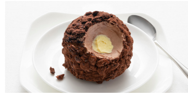
606047 Tartufo Classico Schokoladen-Zabaione-Trüffel Zabaione | Schokolade | Haselnuss

🕒 85 g/ Stk. 📦 12 Stk./ Krt. 🍴 servierfertig