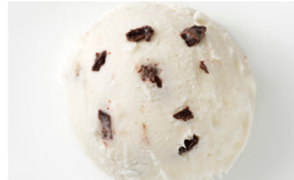
606450 Stracciatella Milchspeiseeis mit Schokoladenstückchen