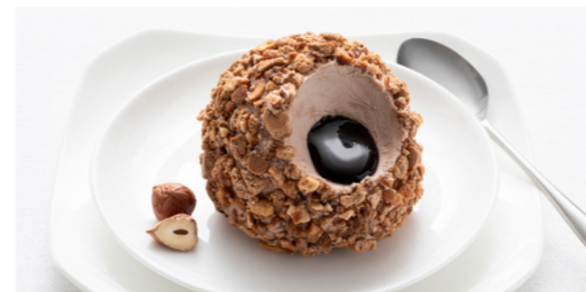
606023 Tartufo Nocciola Haselnuss-Schoko-Trüffel Haselnuss | Schokolade | Baiser

🕒 85 g/ Stk. 📦 12 Stk./ Krt. 🍴 servierfertig