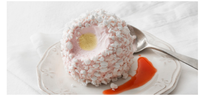
606108 Tartufo Fragola Erdbeer-Vanille-Trüffel Erdbeer | Vanille | Baiser

🕒 75 g/ Stk. 📦 12 Stk./ Krt. 🍴 servierfertig