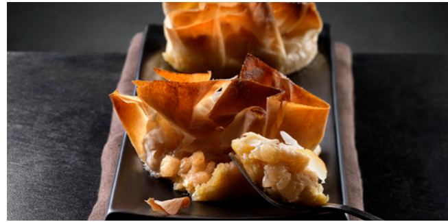
008885 Scrigno Mele e Mandorle Apfel-Mandel-Blätterteigkörnchen Blätterteig | Mandelcreme | Apfel

🕒 100 g/ Stk. 📦 6 Stk./ Krt. ⏱️ ca. 1-2 Std. 🍴 servierfertig