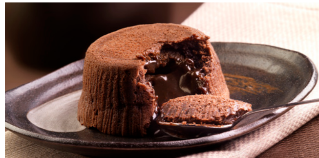
492466 Soufflé al Cioccolato Dunkles Schokoladensoufflé

🕒 100 g/ Stk. 📦 6 Stk./ Krt. ⏱️ ca. 1-2 Std. 🍴 servierfertig