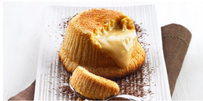
491896 Soufflé al Cioccolato Bianco Weißes Schokoladensoufflé

🕒 100 g/ Stk. 📦 12 Stk./ Krt. ⏱️ 4-10 Min. 🌡️ 180 °C