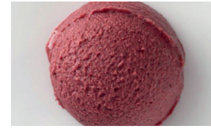
606146 Sorbetto Mirtillo Blaubeersorbet